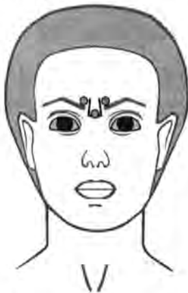
Рис. 1 Точки введения для разглаживания межбровных морщин.

В каждую отмеченную точку вводят препарат РЕЛАТОКС® Токсин ботулинический типа А в комплексе с гемагглютинином от 2,5 до 7,5 ЕД в зависимости от выраженности морщин, возраста и пола. Общее количество препарата, введенного в эту область, не должно превышать 25 ЕД.