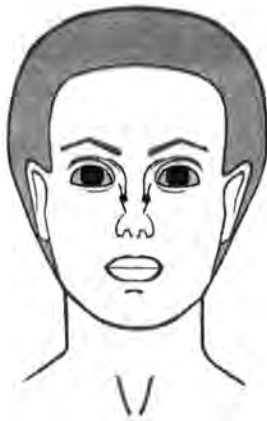
Рис. 4 Точки введения для разглаживания морщин спинки носа.

При наличии выраженных морщин в области спинки носа препарат вводится непосредственно в m. nasalis (мышца носовая) с каждой стороны по 2,5 ЕД препарата.