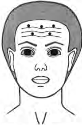
Рис. 2 Точки введения для разглаживания складок лба.

верхним краем брови должно составлять не менее 2 см. Используется 5-10 точек и в каждую вводят от 1,25 ЕД до 2,5 ЕД препарата РЕЛАТОКС® Токсин ботулинический типа А в комплексе с гемагглютинином. При незначительно выраженных морщинах вводится по 2,0-2,5 ЕД в середину лобной области правой и левой стороны. При желании пациента сохранить движение кончиков бровей, точки инъекции можно расположить V-образно. Если у пациента очень высокий лоб и складки образуются близко под линией волос, можно дополнительно ввести по 1,25-2,5 ЕД в 2-3 точки параллельно линии роста волос. Общее количество препарата на данную область не должно превышать 20 ЕД.